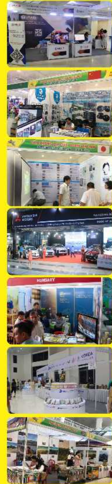
Khu vực lắp đặt hàng quảng cáo của doanh nghiệp ( 3mx4m / hàng)